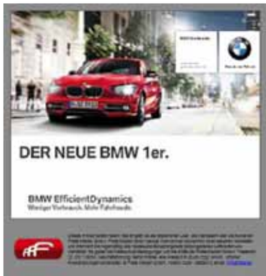
Musterbeispiele für das Individualmailing